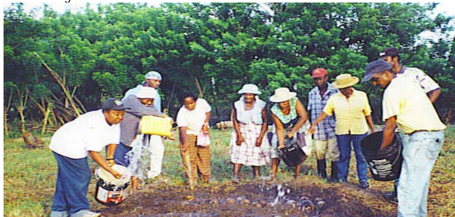
El Comité de Emergencia Garífuna, Honduras

El Comité organizó comités de comunidad en 16 comunidades Garífunas, visitaron escuelas, iglesias y centros comunitarios para establecer espacios seguros para familias desplazadas y realizaron un mapeo de las áreas vulnerables y de alto riesgo en la comunidad. (Encontraron que Santa Rosa de Aguan estará permanentemente en riesgo de inundaciones y ataque de huracanes.) Para lograr la inmediata restauración de las viviendas, establecieron bancos comunitarios de herramientas agrícolas y lucharon por obtener nuevos títulos de sus casas y tierras para ayudar a los residentes afectados. Durante los últimos siete años han trabajado para reconstruir casas, negociar con el gobierno local para suministros de construcción adicionales, y han establecido con éxito casi a 200 familias en casas en la nueva comunidad de Santa Rosa de Aguan con una elevación más alta. El Comité también trabaja por resiliencia a largo-plazo concentrándose en reforestación, preservación de la identidad cultural, organizando a la juventud, y aumentando la seguridad alimenticia a través del procesamiento de yuca, el almacenamiento de comida y la creación de bancos de semilla indígenas.