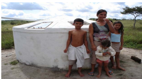
Red de Pintadas, Brasil