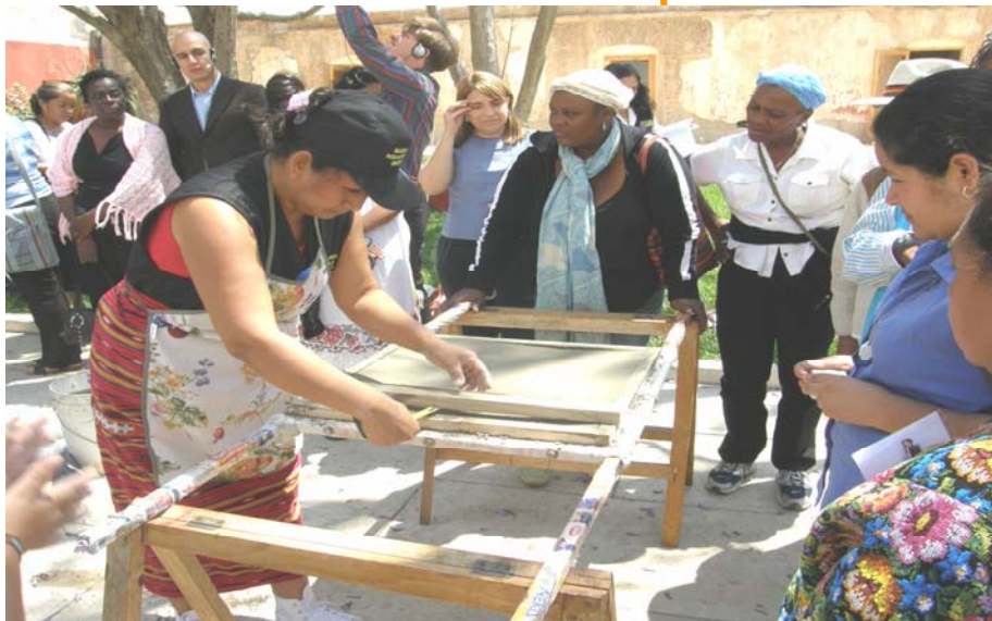
Mujeres Unidas presentaron su técnica de construcción de ladrillos a las participantes del taller.